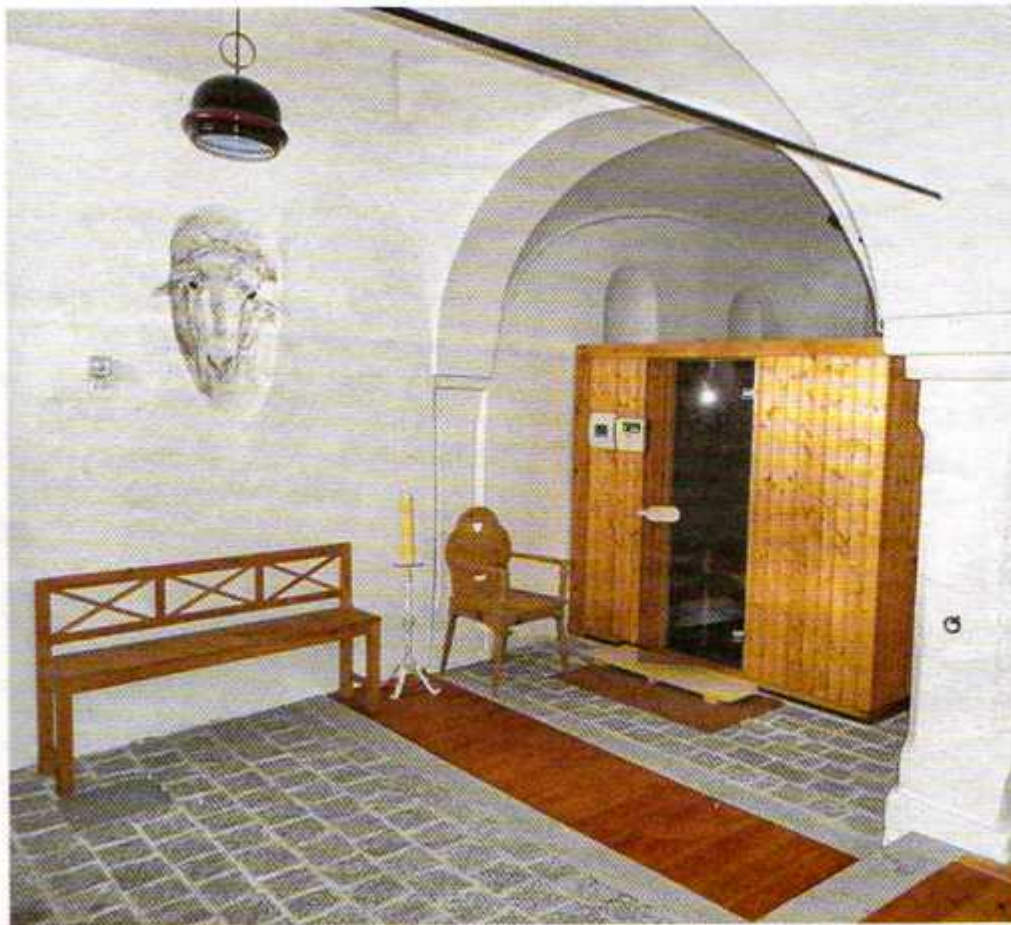
Kellergewölbe mit Sauna und Tier-Fresken von Macfarlane

rin geschickt hier in Fresco-technik Leben einhauchte.