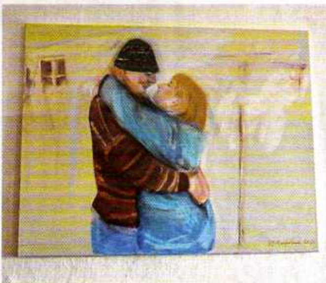
Die Hausherren im Gemälde der Künstlerin Helen Macfarlane

aus Mauthausen gebürtige Steinexperte, der aus einer Steinmetzfamilie stammt, lebt seine Liebe zu edlem Stein nun mit der Herstellung von Steintellern und Obstschalen aus.