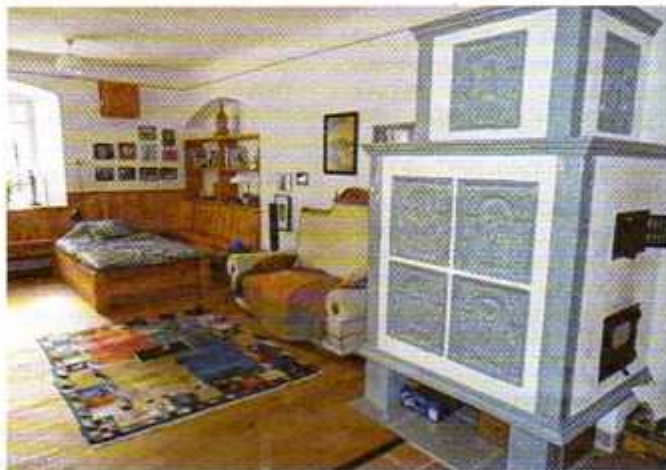
Früher Gaststube des Braugasthofes, nun zentraler Wohnraum